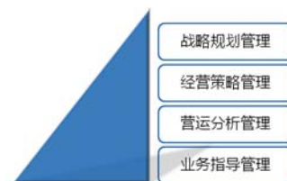
图1-1 数据化管理的四个层次

通过数据收集、数据监控、数据追踪等手段透视业务，通过数据分析、数据挖掘等方式搭建业务管理模型来提升业务。业务指导管理的范畴包括销售、人力资源、生产、财务、客服等业务单元。主要管理模块有目标及预测管理、利润及费用管理等。