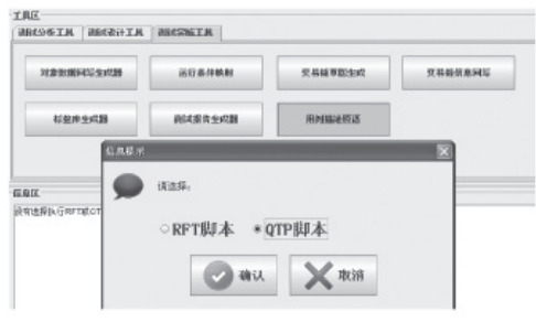
图6 测试框架工具运行实例

试数据相互脱离,在回归测试中仅通过对控制文件的修改就可以对相同功能、不同数据的用例进行测试,同时,测试脚本不关心测试用例,测试的数据和业务逻辑都集成在测试数据表格之中,测试的设计就简化为测试数据表格的设计,程序运行实例如图6所示。